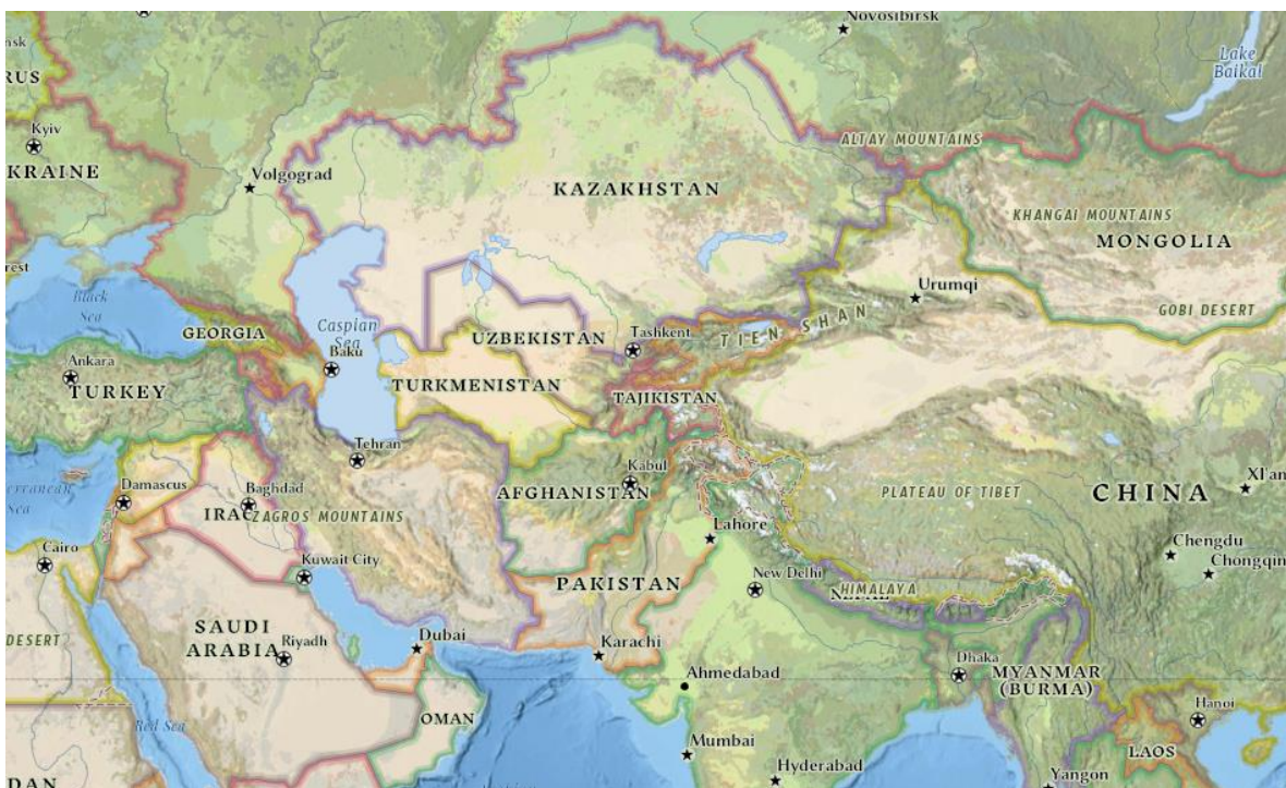
Uzbekistan și poziționarea sa geografică la nivel regional

Din această cauză, în momentul în care Mirziyoyev a preluat puterea, chiar și în perioada de tranziție până la confirmarea sa oficială prin alegeri, abordarea a revenit la un ton conciliant, în care a fost acordată o importanță sporită cooperării regionale în Asia Centrală. În primul discurs la Adunarea Generală ONU în calitate de președinte, Mirziyoyev sublinia „ Fiind în inima Asiei Centrale, Uzbekistan este deosebit de interesat ca regiunea să devină o zonă de stabilitate, dezvoltare durabilă și bună vecinătate ” 24 .